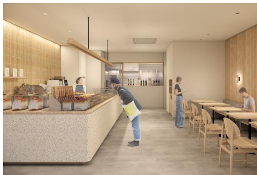
Et Nunc Daikanyama の店内イメージ