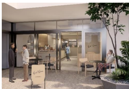
エントランスイメージ

路面店のような開放感やパン作りのライブ感と調和する居心地のよい空間で、素材のおいしさを感じられるパンをお召し上がりいただけます。