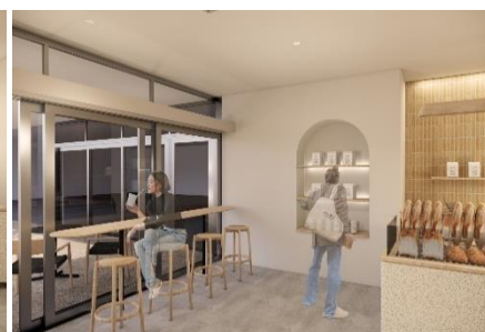
ハイカウンターエリアのイメージ