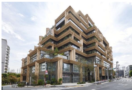
Forestgate Daikanyama 外観