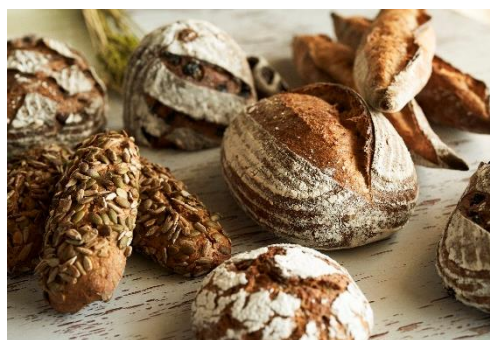
パンの集合イメージ