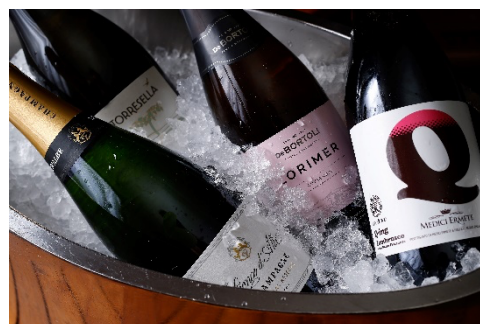
お飲み物イメージ

<パレスホテル東京に関する一般の方からのお問い合わせ/ご掲載用お問い合わせ> パレスホテル東京