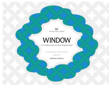
インスタレーション イメージ