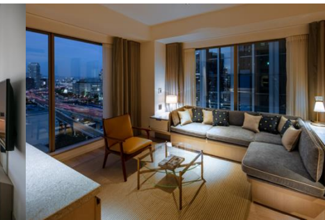
大阪の街が一望できる Suite (57㎡)