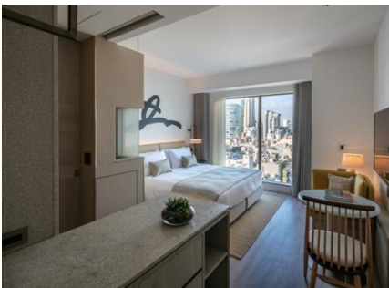
必要な機能がそろった客室 Studio (25㎡)