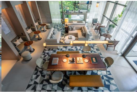
ゆったりとしたゲストラウンジ