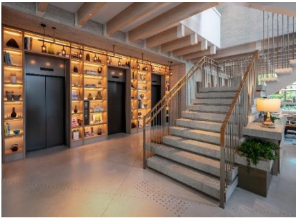
ロビー 正面には2階へ続く階段